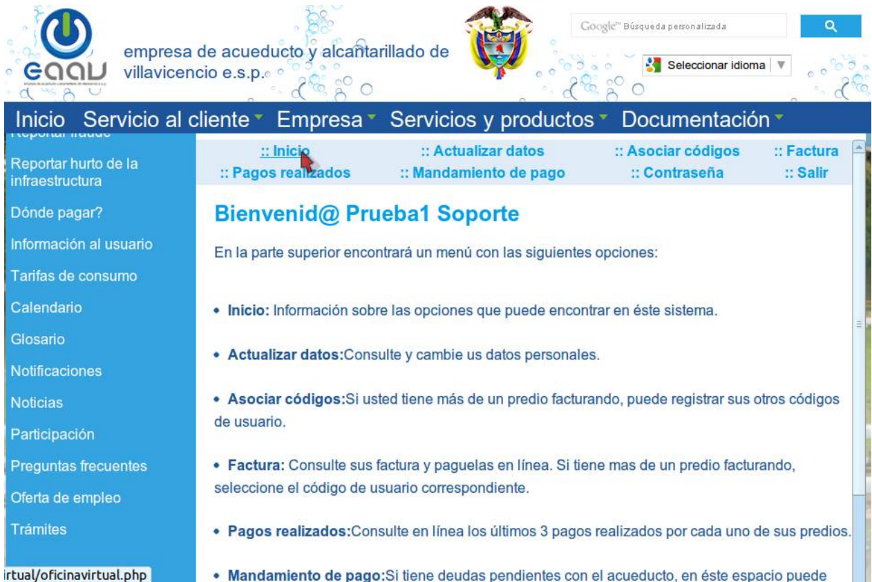
Imagen 8. Página de inicio.

Describe brevemente para que sirve cada opción del submenú.