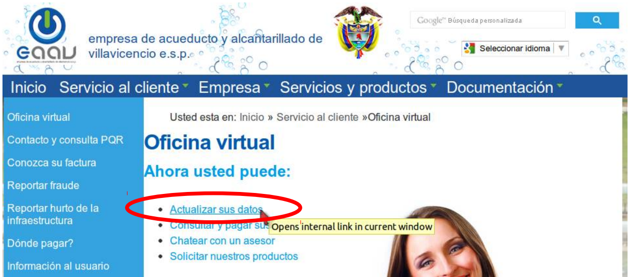
Imagen 2. Seleccionar el link “Actualizar sus datos”.