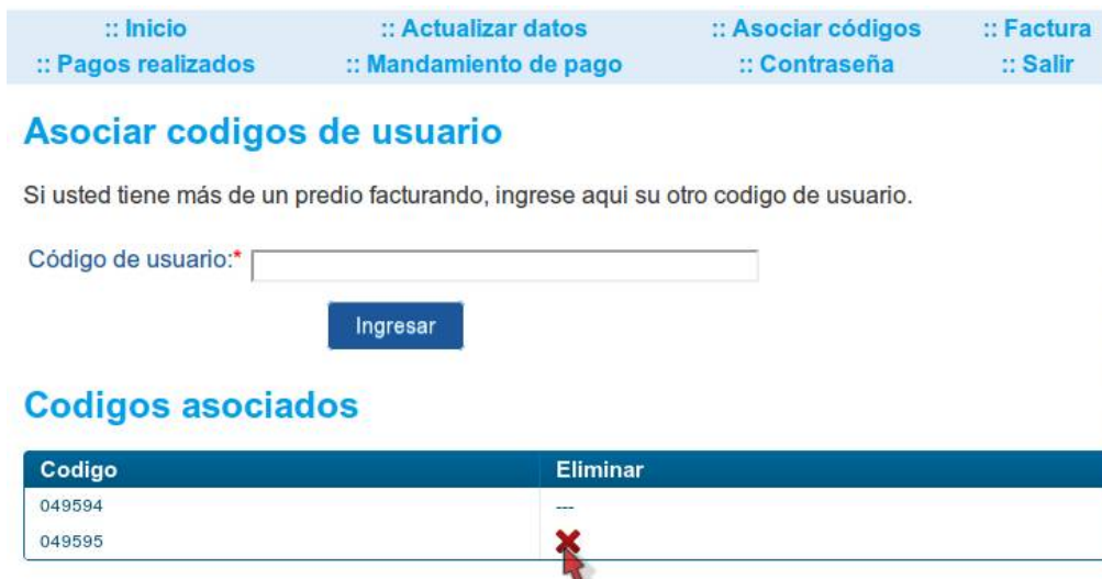
Imagen 10. Módulo para ver, eliminar e ingresar códigos.

Nota: Si desea eliminar el código principal debe enviar un mensaje con su petición al correo electrónico del área de sistemas: sistemas@eaav.gov.co .