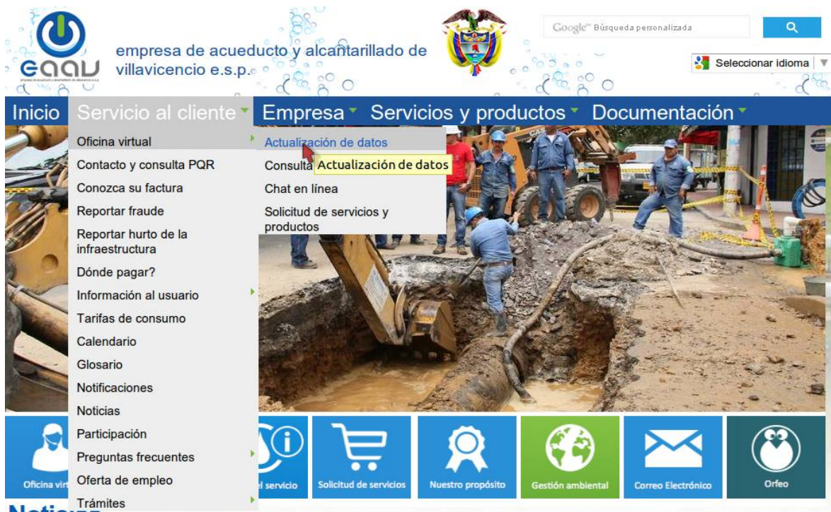
Imagen 3. Ruta hacia la oficina virtual desde el menú principal.

En el menú que se encuentra en la parte superior de la página, seleccione la opción Servicio al cliente → Oficina virtual → Actualización de datos, así llegará al formulario de inicio de sesión.