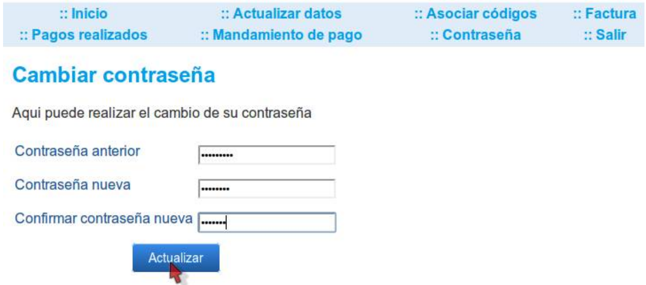
Imagen 16. Módulo para el cambio de contraseña.

Le permite cambiar la contraseña de su cuenta para mantener la seguridad de la misma.