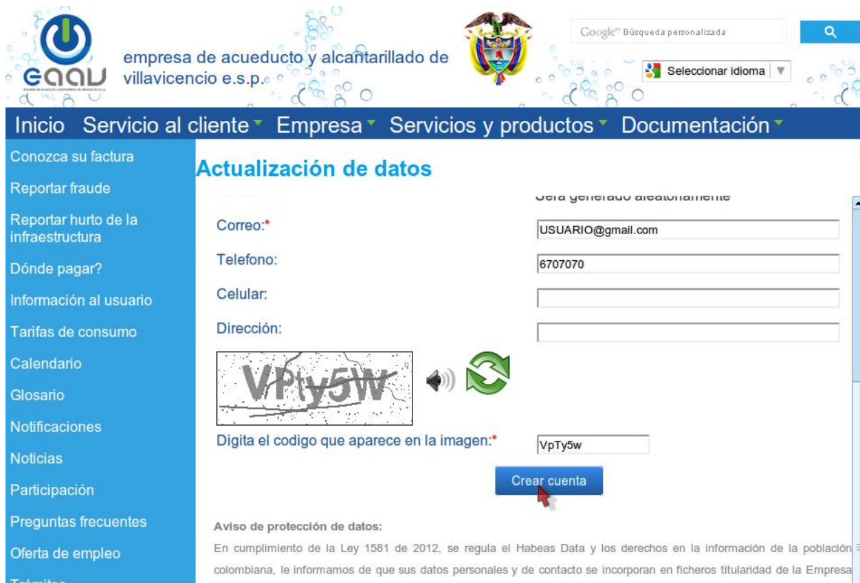
Imagen 7. Formulario para recordar contraseña.

Si ya se registró, pero no recuerda su contraseña, elija la opción “Olvido su contraseña”. En ella ingrese su dirección de correo (la misma que ingreso cuando creo la cuenta), el sistema validará que ésta se encuentre registrada, si es así, se enviará a ese correo un mensaje indicando cual es su nueva contraseña.