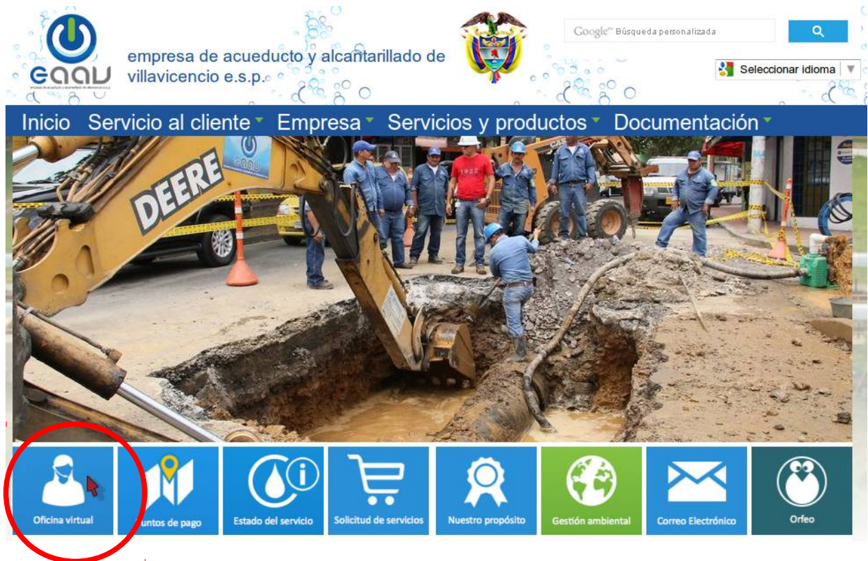
Imagen 1. Icono que identifica a la oficina virtual en la pagina principal del acueducto.

En la página principal del acueducto, buscar en el icono que representa la oficina virtual y dar click sobre él.