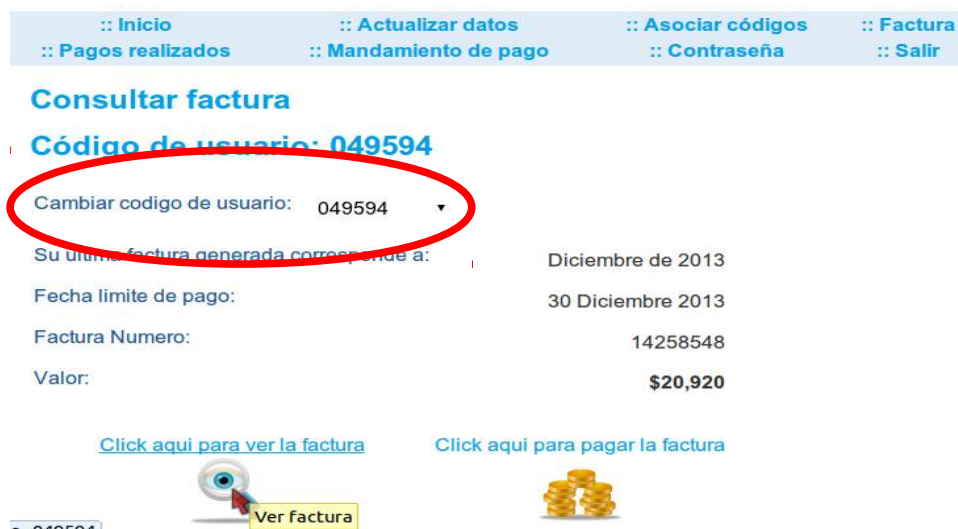
Imagen 11. Módulo de factura. Seleccionar el codigo de usuario a consultar (circulo rojo).

Permite consultar los datos de sus facturas inscritas, descargar el recibo y realizar el pago en línea. Primero debe seleccionar el codigo de usuario correspondiente (por defecto siempre aparece el principal), si sólo tiene uno no debe seleccionar nada. En la parte inferior aparecerá el mes al que corresponde la ultima factura, la fecha de vencimiento, numero de la factura y el valor correspondiente.